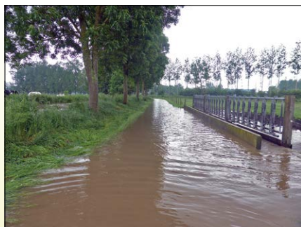
Resultaat van een wolkbreuk boven Zoutleeuw.