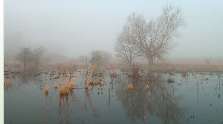
Natuurlijke waterberging in overstroombare komgrond van de Grote Vliet/Getevallei: klimaatbuffer in de praktijk.

Natuurpunt Oost-Brabant ziet het als een grote uitdaging om de Getevallei vanaf de taalgrens in Hoegaarden, over Tienen, Landen, Linter, Zoutleeuw, Geetbets tot aan de monding in Halen als een aaneenschakeling van samenhangende grote natuurcomplexen van Europese allure te realiseren. Wat nu nog een lappendeken is van percelen kriskras met daartussen meer intensief gebruikte kavels zou in de toekomst tot een robuust valleisysteem kunnen uitgroeien. Hier is er nog ruimte voor de rivier en natuurlijke processen. Als dunbevolkte en landschappelijk uitgestrekte riviervallei met veel structurele variatie, biedt de Getevallei eindeloos potentieel om tal van ecosysteemdiensten te vervullen zoals versterking van de biodiversiteit en klimaatbuffering, maar ook recreatie. Dit biedt kansen voor de economische ontwikkeling van de Getestreek, zeker in combinatie met het rijke historische erfgoed ervan. En het wordt bovendien aantrekkelijker om hier te wonen.