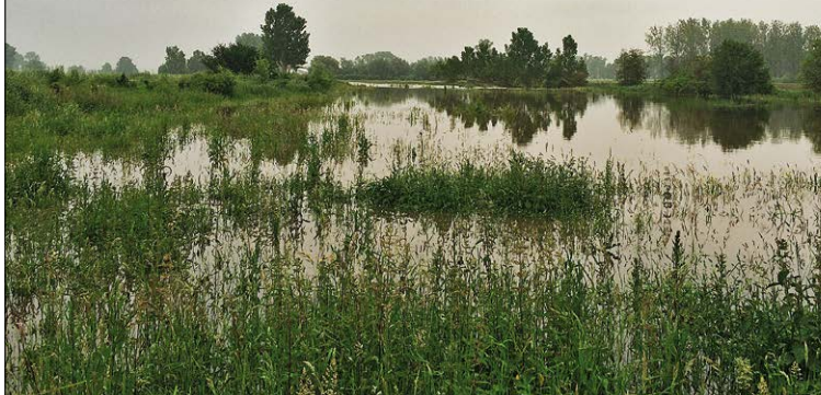
Aronst Hoek, groots waterrijk Natuurgebied van 360 ha in de Getevallei.

In de Getevallei bouwde Natuurpunt de laatste 20 jaar van Hoegaarden tot Geetbets een netwerk van beheerde natuurgebieden uit: de Getebeemden, het Tiens Broek en de Laterbroeken, Doysbroek en het provinciaal gebied Grote Gete, Viskot en Meertsheuvel. In de Kleine Getevallei heeft ook de provincie een aanzienlijke inspanning gedaan voor de uitbouw van Het Vinne en het provinciale project Grote Ge(k)te. Ten slotte is er het complex Betsbroek-Aronst Hoek, Rummens Bos in het uiterste oosten van de provincie waar Natuurpunt meer dan 360 ha natuurgebied verworven heeft in een grootse vallei met vele mogelijkheden voor natuurontwikkeling. Tot het stroomgebied van de Gete behoren ook de Hoegaardse Valleien en de Beemden in Landen.