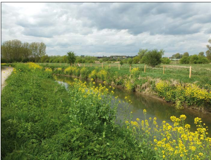
De Gete. Hier zijn nog grote mogelijkheden voor de ontwikkeling van een robuuste vallei.

Natuurpunt Oost-Brabant is er de laatste jaren in geslaagd om de Getevallei in Vlaanderen op de agenda te zetten als robuust riviersysteem met grote kansen en mogelijkheden voor natuurontwikkeling. Hier is nog ruimte voor beheerde natuur, voor de waardevolle half natuurlijke landschappen en soortenrijke graslanden met erfgoedwaarde. Daarnaast is er ook plaats voor ruigere natuur en moerasbossen en voor eerder spontane ontwikkeling. En dit op een schaal die op vele andere plaatsen niet meer mogelijk is.