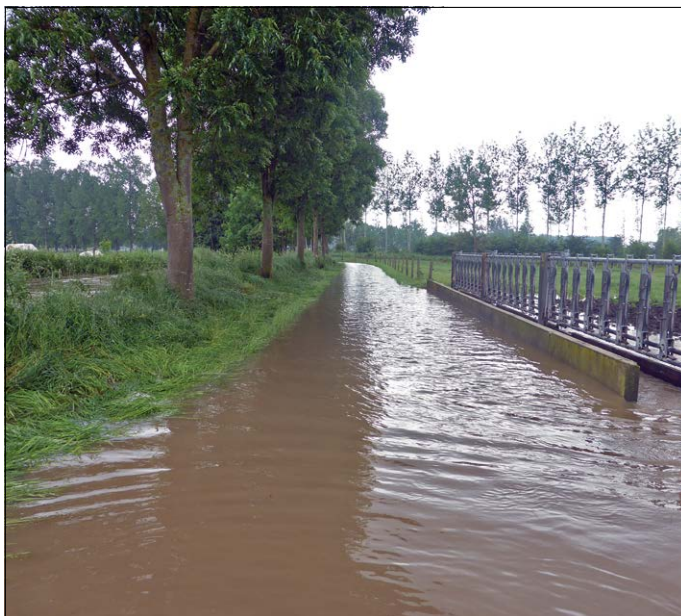
Overstroming ten gevolge van extreme zomerse neerslag in 2016.

Als gevolg van de opwarming zullen steeds vaker extreme hoeveelheden neerslag zorgen voor overstromingen. Ook langere perioden van droogte zullen toenemen.