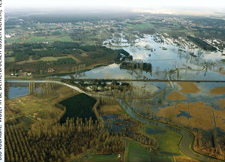
Foto voorkant: Water in de Demerbroeken tussen Zichem, Testelt en Averbode.