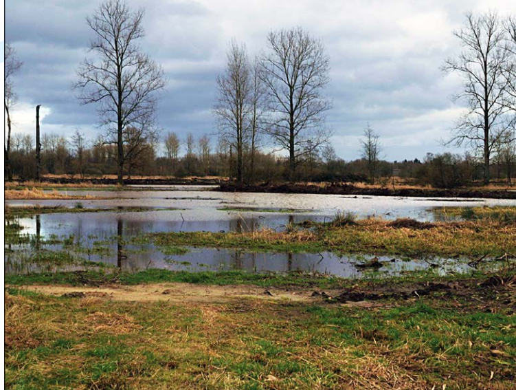
In het Natuurgebied De Demerbroeken mag de rivier nog overstromen.

De natuurlijke waterberging is in Vlaanderen sterk achteruit gegaan door de constante toename van verharde oppervlakte. Bovendien zijn de meeste waterlopen recht getrokken of 'genormaliseerd', de valleigebieden gedraineerd voor de intensieve landbouw en is de natuurlijke plantengroei die water kan ophouden en absorberen, verdwenen. Rivieren recht trekken om het water sneller af te voeren en steeds hogere dijken maken, zorgen enkel voor meer wateroverlast en modderstromen in steden en dorpen stroomafwaarts.