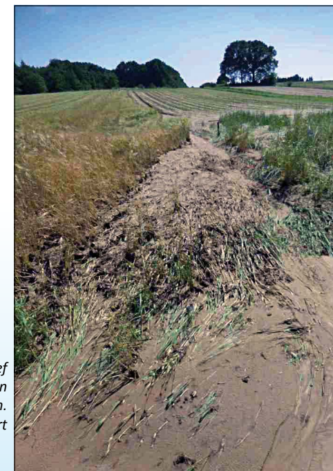
Erosie vanuit intensief bewerkte akkers: een groot probleem.

Wat daarentegen nodig is, is een totaalaanpak: meer ruimte voor de rivier en waterberging en natuur over de hele vallei en de hele gradiënt en niet hier en daar gestapeld en geconcentreerd in een compartimentje waar een reservaat gelegen is.